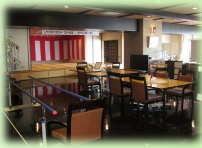
1階 デイフロアー …デイフロアーとし