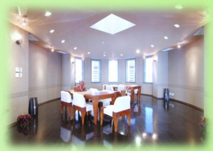
活動の場として …手芸ボランティアや 映写会会場としても利用。