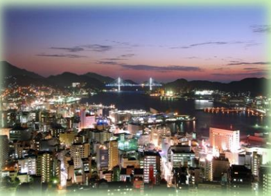
施設からの眺め …長崎港が全貌できます。 夜景も素敵です。