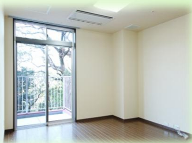
居室 …全室個室です。 (思い出の品、使い慣れた家具を)