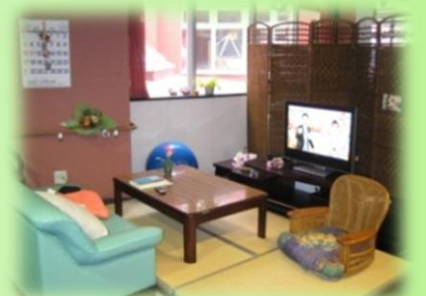
リビング 2 …畳のスペースもありますので ゆっくりくつろいで頂けます。