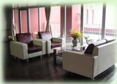
共有スペース …交流の場としても 趣味・活動の場として。