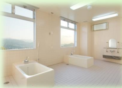
浴室 1 …素敵景色を見ながら ゆったりご利用頂けます。