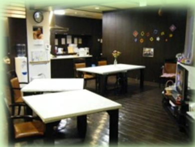
リビング …お食事や団らんの場として。